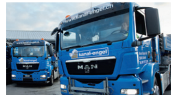
Gewerbe / Industrie