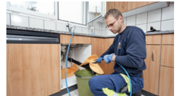
Hausbesitzer / Verwaltungen